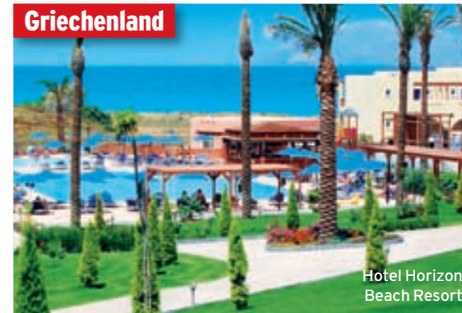
Hotel Horizon Beach Resort