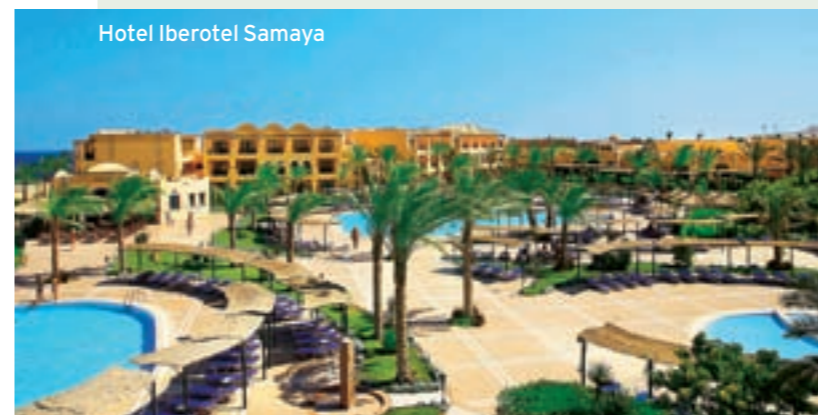
Hotel Iberotel Samaya

»Nur 10 Minuten vom Flugplatz« »Disco für Ältere (40) furchtbar« »Richtig gut fanden wir die Musik«