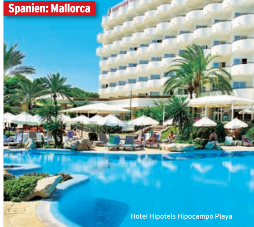
Hotel Hipotels Hipocampo Playa