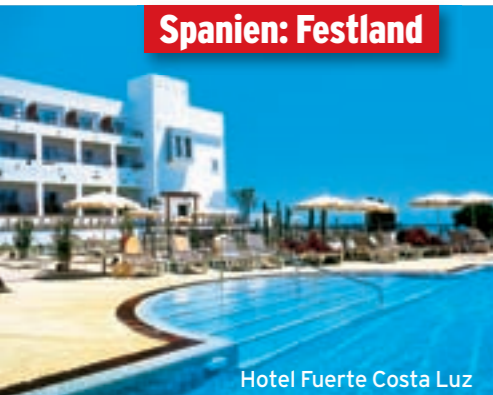
Hotel Fuerte Costa Luz