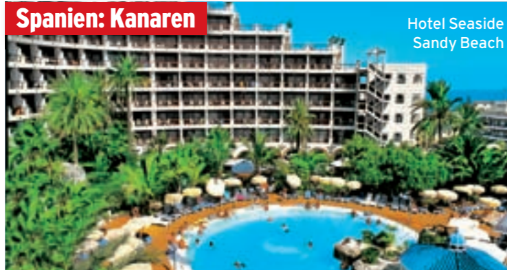
Hotel Seaside Sandy Beach