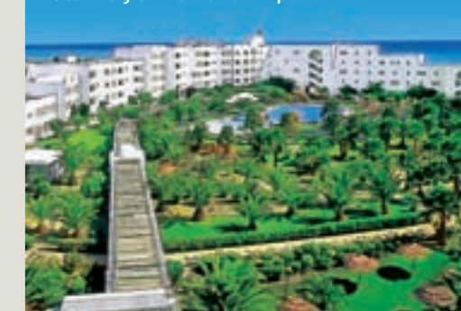
Hotel Magic Life Manar Imperial

»Animateure und Wassersportteams stehen fast rund um die Uhr zur Verfügung«