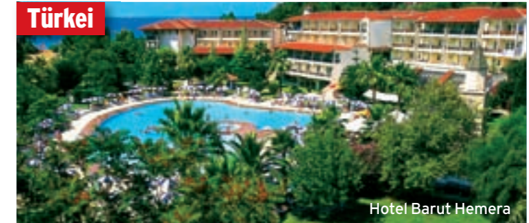
Hotel Barut Hemera